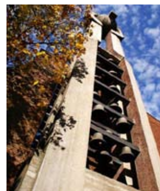
Missionskyrkan i Uppsala.