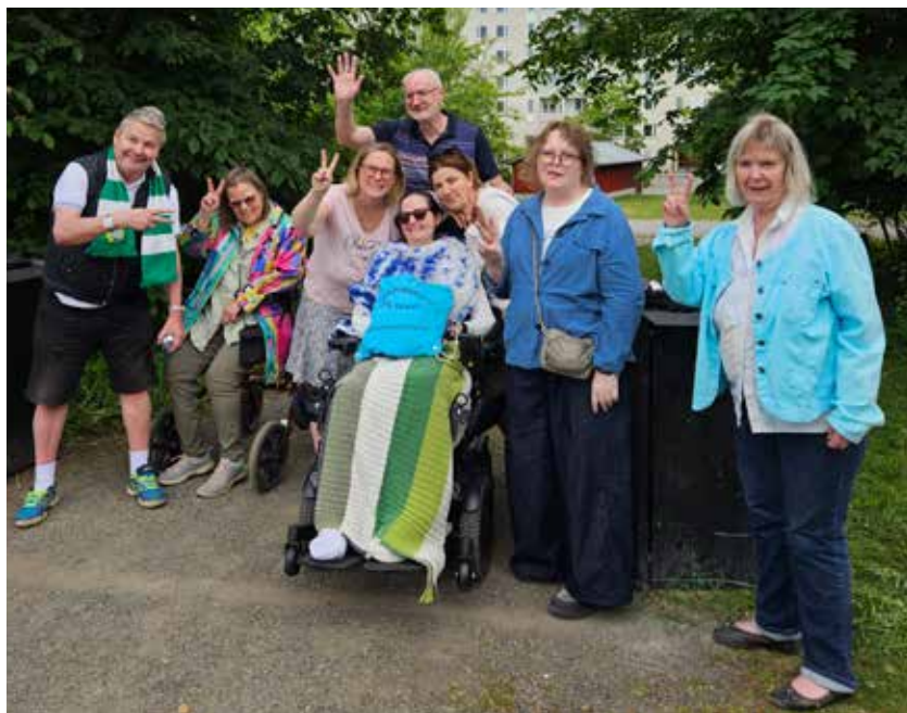
Ett gäng glada boulespelare på utkiksplatsen i Liljeholmen.