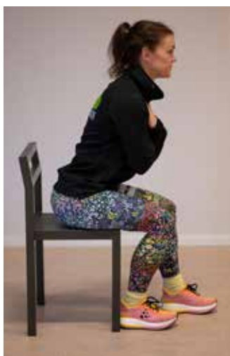
Uppresning en fot fram.